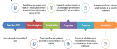
Gráfica 1 Estructura del Plan de Desarrollo Institucional 2018-2022